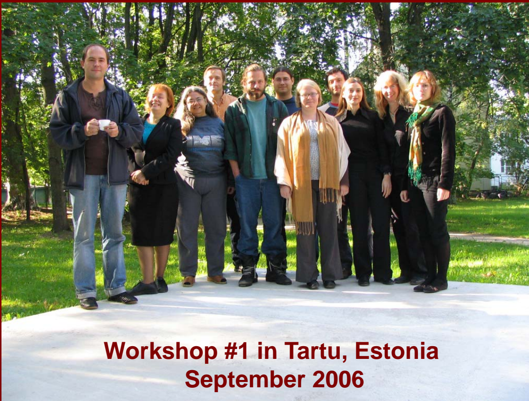
Workshop #1 in Tartu, Estonia September 2006